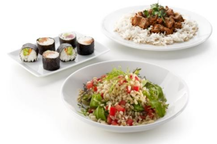
Rizs- és gabonakészítmények számos variációja