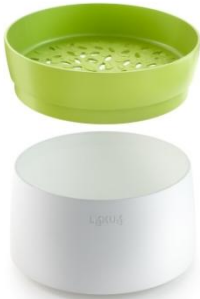
4 adag 12 perc alatt

Rizs és gabonafélék mikrohullámú sütőben történő főzéséhez Tiszta és ízletes eredmény – néhány perc alatt!