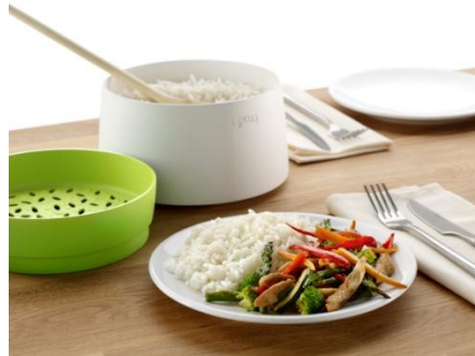
Főző- és tálalóedény egyben